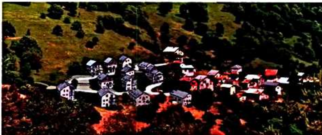
Vue projetée du futur lotissement et du hameau de " Montmagny "

Contact : Mairie de SAINT MARCEL - tél. : 04.79.24.04.24