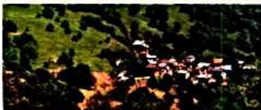
Vue actuelle du hameau de " Montmagny "