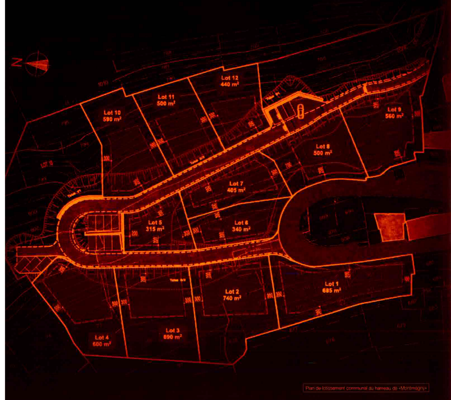
Plan de lotissement communal au hameau de «Montmagny»

Du lundi au jeudi de 8h30 à 12h et de 14h à 17h30 Le vendredi de 8h30 à 12h et de 14h à 17h.